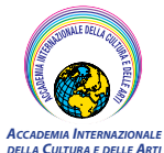
ACCADEMIA INTERNAZIONALE DELLA CULTURA E DELLE ARTI