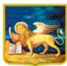
PATROCINIO REGIONE DEL VENETO